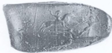
Fig. 1. PFS 95* on PF 694.

تصویر شماره ۱- مکان جغرافیایی پارسوماش و انشان (Imanpour, 2002:69)