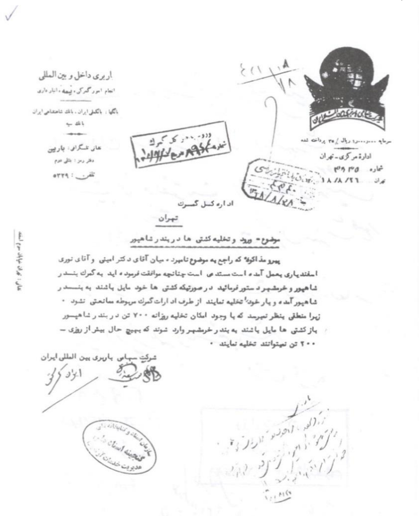
سند شماره ۱: برتری ظرفیت تخلیه بند شاپور نسبت به بند خرمشهر سال ۱۳۱۸ (ابن رحمان، بندر امام خمینی (۵) ) از منظر اسناد تاریخی، بخش ضمائم