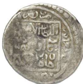
تصویر ۵: سکه شیخ اویس، محل نگهداری: مجموعه بقعه‌ی شیخ صفی الدین اردبیلی.