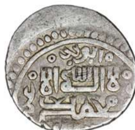
تصویر ۳: سکه شیخ اویس، محل نگهداری: موزه ملک.