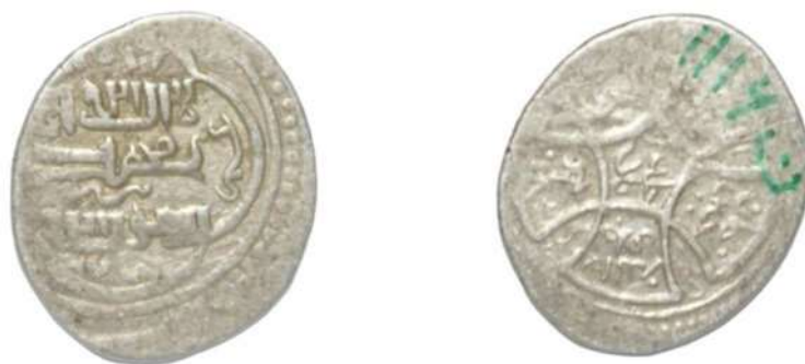
تصویر ۶: سکه خان حسین، ضرب تبریز، محل نگهداری: مجموعه‌ی بقعه‌ی شیخ صفی الدین اردبیلی.