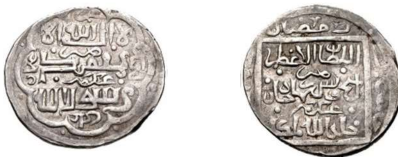
تصویر ۱۵: سکه شیخ‌اویس، ضرب عسکر