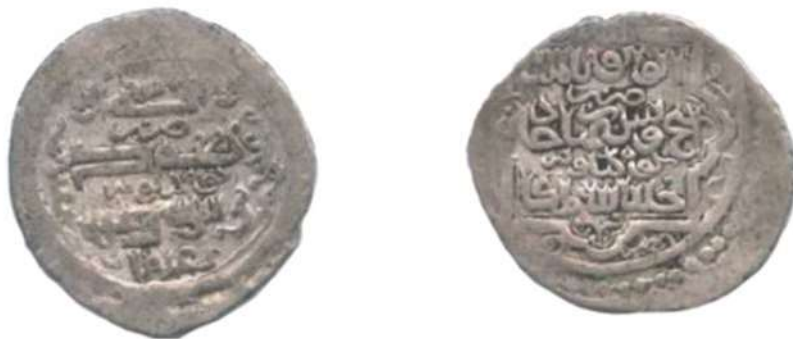
تصویر ۱۴: سکه شیخ‌اویس، ضرب کوه کیلویه، به تاریخ ۷۵۷ ه.ق، محل نگهداری: موزه بانک سپه