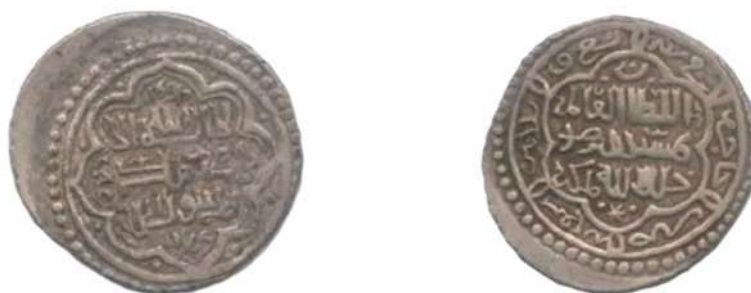
تصویر ۱۲: سکه شیخ حسن، ضرب جاجرم، به تاریخ ۷۳۹ ه.ق، محل نگهداری: موزه بانک سپه