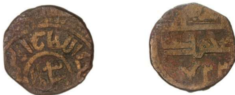
تصویر ۲. سکه شیخ اویس، محل نگهداری: موزه ملک.