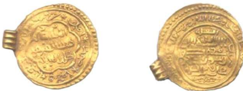
تصویر ۱. سکه شیخ حسن، ضرب أمل به تاریخ ۷۴۲ ه.ق، محل نگهداری: موزه بانک سپه.

و شاه‌شجاع (خواندمیر ج ۳، ۱۳۸۰: ۲۴۳)، توانست آذربایجان را حفظ کند. اما پس از کشته شدن خان حسین، در دوران سلطان احمد بر اثر حمله‌ی تیمور، تبریز و آذربایجان دچار بی‌ثباتی شد (خواندمیر ج ۳، ۱۳۸۰: ۲۴۷). فرمانده تیمور در سال ۷۸۸ ه.ق توانست تبریز را به تصرف خود درآورد و سلطان احمد شکست خورد و به بغداد بازگشت ۱ (حافظ ابرو، ۱۳۵۰: ۲۸۶).