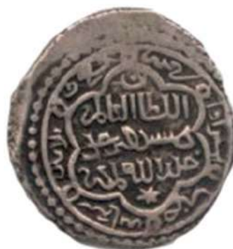
تصویر ۴: سکه شیخ حسن، محل نگهداری: موزه بانک سپه.