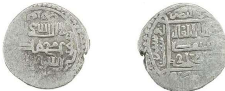
تصویر ۹: سکه شیخ حسن، ضرب بصره، به تاریخ ۷۴۶ ه.ق.