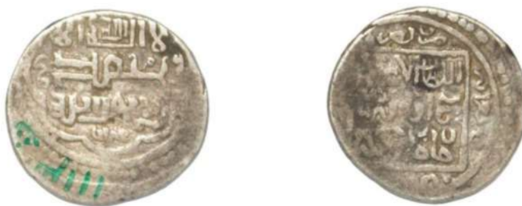
تصویر ۱۰: سکه شیخ اویس، ضرب بصره، محل نگهداری: مجموعه ی بقعه ی شیخ صفی الدین اردبیلی