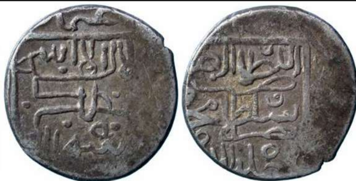
تصویر ۸: سکه محمود، ضرب بصره.