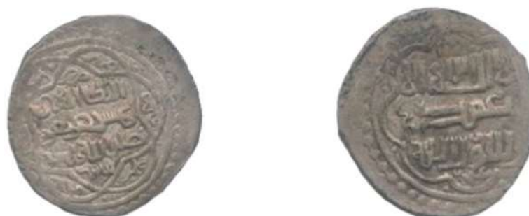
تصویر ۱۳: سکه شیخ حسن، ضرب نیشابور، به تاریخ ۷۴۱ ه.ق، محل نگهداری: موزه بانک سپه