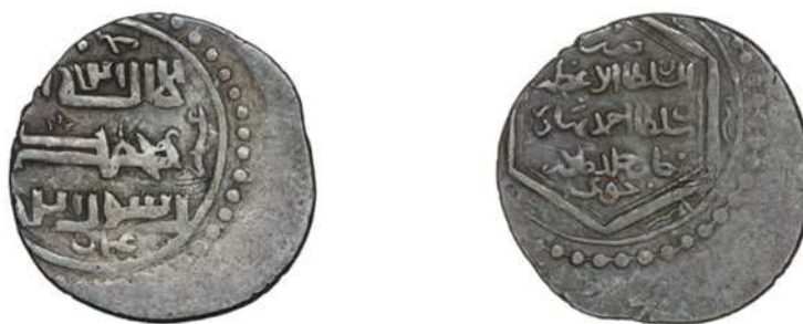
تصویر ۷: سکه سلطان احمد، ضرب خوی، محل نگهداری: موزه ملک.