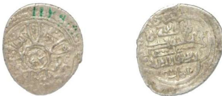
تصویر ۱۱: سکه خان حسین، ضرب شماقی، محل نگهداری: مجموعه‌ی بقعه‌ی شیخ صفی الدین اردبیلی