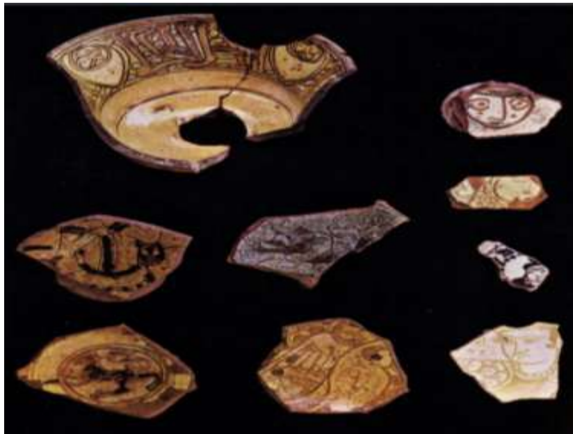
خرده سفال‌های یافت شده در فسطاط

در آنجا انبار شود (Sato, 2015: 180 and 185). این شهر در قرن پنجم ه.ق کاروانسرای به نام «دارالوزیر» داشته که فقط مخصوص خرید و فروش نیشکر بوده است (ناصر خسرو، ۱۳۳۵: ۶۹). فسطاط در این سال‌ها آن‌چنان در صنعت شکر پیشرفت کرد که به مرکز انتشار فنون و نوآوری‌های مربوط به این صنعت تبدیل شد که بخش مهمی از این پیشرفت را مرهون بهبودیان بود؛ تاجرانی که هم در فرآیند تولید و هم در تجارت آن فعالانه مشارکت داشتند و به همین دلیل با شهرت «سُگری» شناخته می‌شدند (Ouerfelli, 2008: 75,301 and 431). البته محصولاتی هم وجود داشت که به صورت غیرمستقیم به این صنعت وابسته بود؛ چراکه فسطاط قنادان ماهری داشت که شیرینی‌های بادامی تولید می‌کردند (Lev and Amar, 2008: 94). در این دوره فسطاط در تولید ظروف سفالی و شیشه‌ای نیز موفق عمل می‌کرد. همگام با افزایش چشمگیر واردات ظروف چینی به آن، صنعتگران نیز توانستند به تقلید از این ظروف، ظروفی را به صورت انبوه تولید نمایند (Scanlon, 1970: 85) که در وهله اول مورد استفاده اهالی فسطاط قرار می‌گرفت. این ظروف شامل سفالینه‌هایی بود که کوزه‌های ساده آب و بدون لعاب تا قدح‌های لعاب‌دار را در برمی‌گرفت (Milwright, 2010: 85).